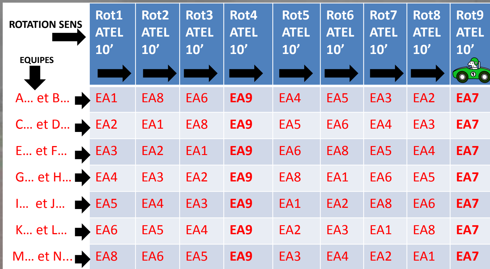
Tableau Rotation ateliers (Eveil athlétisme) de A à N